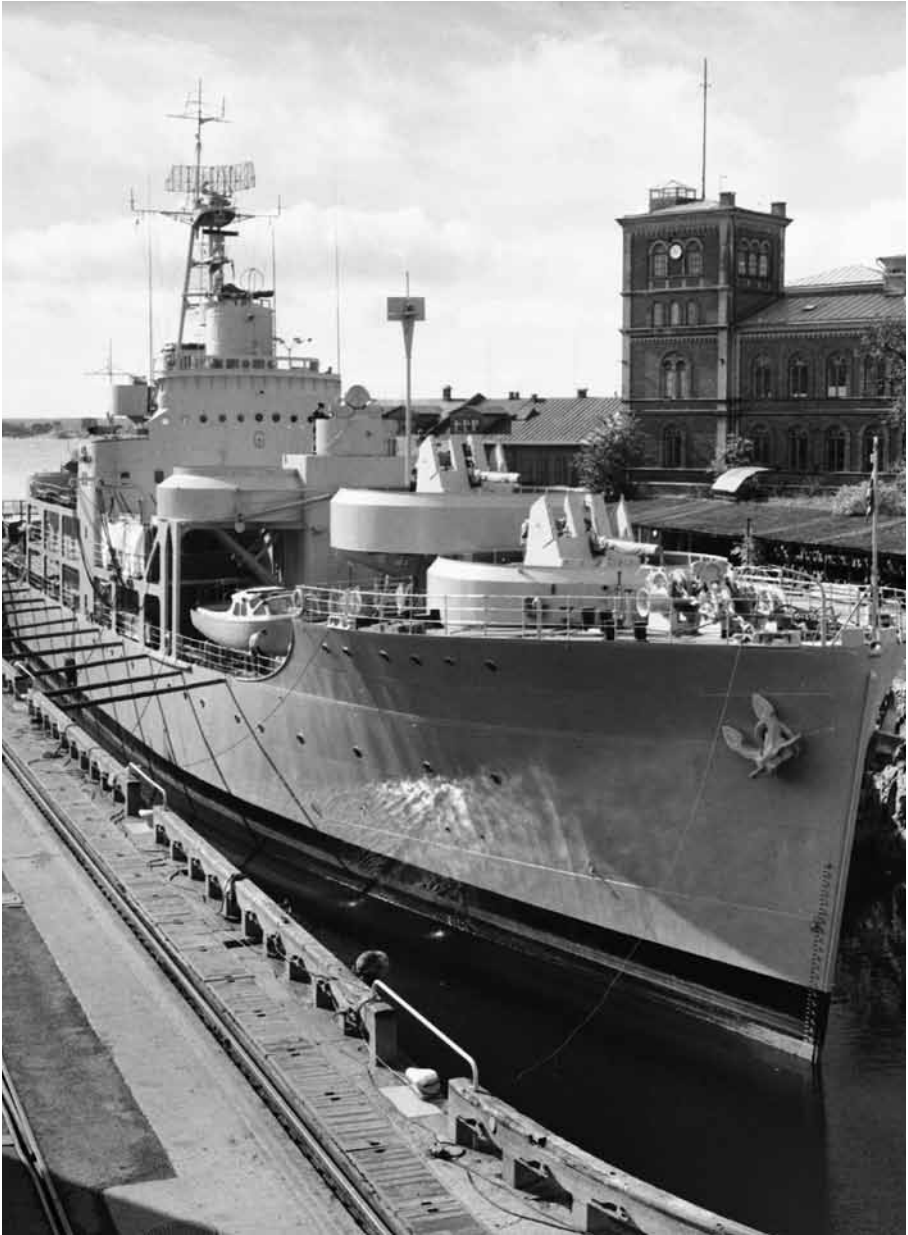
HMS Älvsnabben.