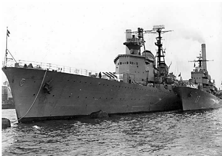
HMS Göta Lejon.