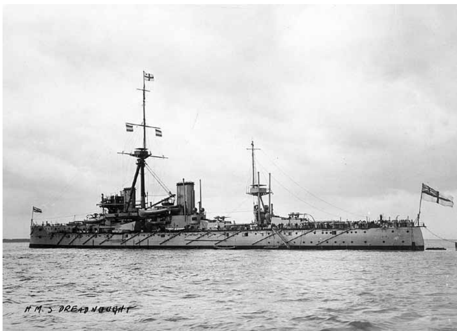
HMS Dreadnought.

Tvivel på den egna förmågan började uppstå fram mot 1910-talet. Den britiska HMS Dreadnought från 1906 hade gjort alla äldre pansrade fartyg underlägsna. De svenska fartygen framstod nu som omoderna. Skulle man fortsätta på den inslagna vägen eller skulle en ny flottpolitik återföra flottan till 1870-talets inloppsförsvär? Kanske skulle torpedbåtarna ges en större roll? 45 Här stod debatten när kriget bröt ut.