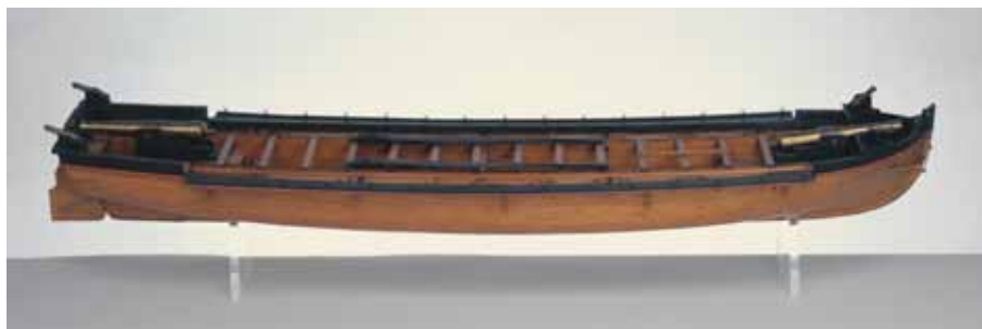
Kanonslupen, vanligtvis bestyckad med två 24-pundiga kanoner, kom att bli kärnan i den svenska skärgårdsflottan. Med sin ringa besättning och tunga bestyckning utgjorde fartygstypen ett avgörande hot mot den traditionella galären.