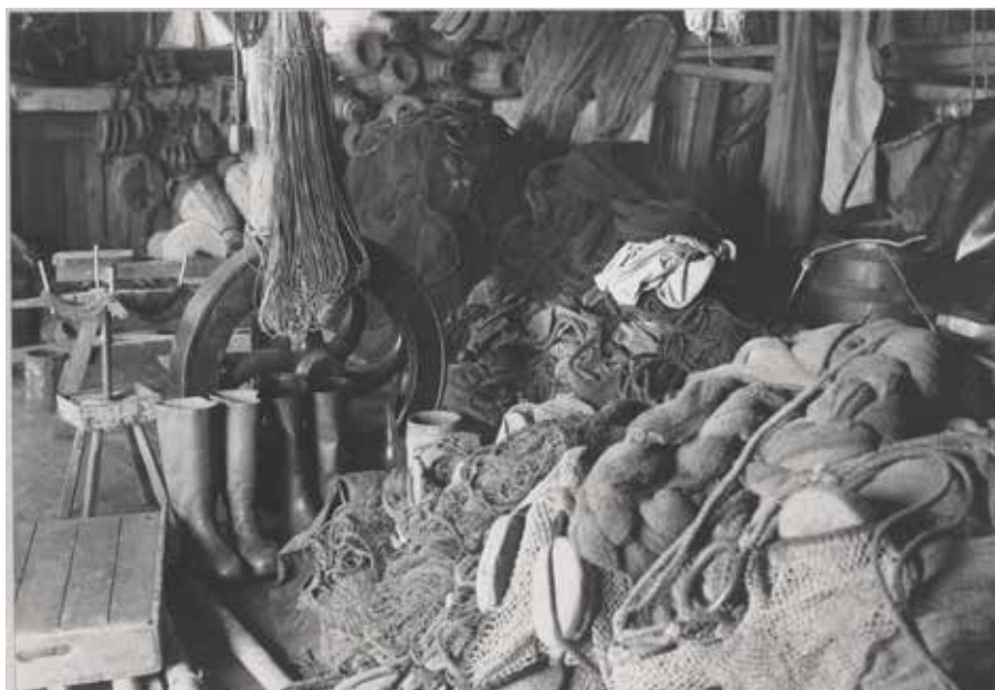
Sjöbodsinteriör. Mångfalden av redskap och båtar speglar fiskarkulturens ständiga behov av att anpassa sig efter säsong och fiske.

med deras medsystrar i städer och byar. Den maritima kulturen kan sägas existera tack vare kvinnors försörjning som bestod av s.k. binäringar. Dessa binäringar är flexibla och kan bestå av insamling av vrak, dun, ägg och bär samt småfiske. Den maritima kvinnan är även delaktig i fiskerinäringen genom att ta hand om fångsten och i viss utsträckning även fiskeredskapen. Detta var särskilt förekommande i storfiskebygderna i mellersta Bohuslän. 40