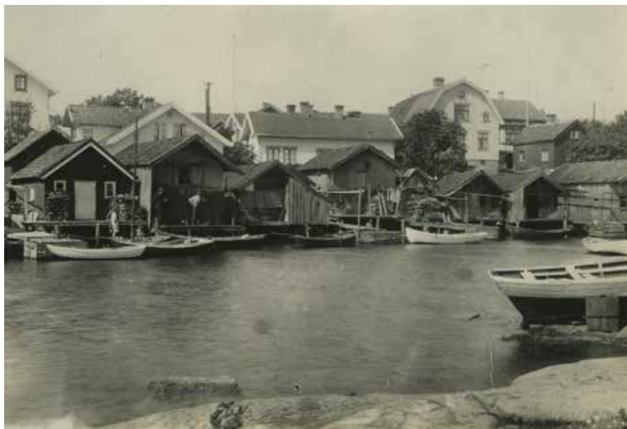
Vad kännetecknar ett bohuslänskt fiskeläge? Närheten mellan bostad, brygga, bod och båt.

eras även i ett så begränsat område som Kattegatt-Skagerrak. 22 Exempel på olika tolkningar av kulturer i Kattegatt-Skagerraks kustområden är de slutsatser som dragits i Kattegat-Skagerrak projektet respektive Västerhavets kulturarv . Kattegat-Skagerrak projektet genomfördes under 1980-talet och inkluderade forskare från Norge, Sverige och Danmark. De deltagande forskarna undersökte förändringar i vardagsliv och kontaktmönster mellan kustregionerna kring Kattegatt-Skagerrak under 1800-talet. Projektet diskuterade teman som fiske, handel, migration, väckelserörelser, föreningsliv, kulturella mötesplatser mellan borgerskap och allmoge, samt respektive kustregions relation till centralmakten. 23 Västerhavets kulturarv var ett Interreg-projekt som pågick åren 2009–2011. Syftet med projektet var att sammanföra universitet och museer för att skapa förståelse och intresse för ett regionalt kulturarv som kan användas som komplement till den nationella historieskrivningen. Projektet undersökte om det är möjligt att