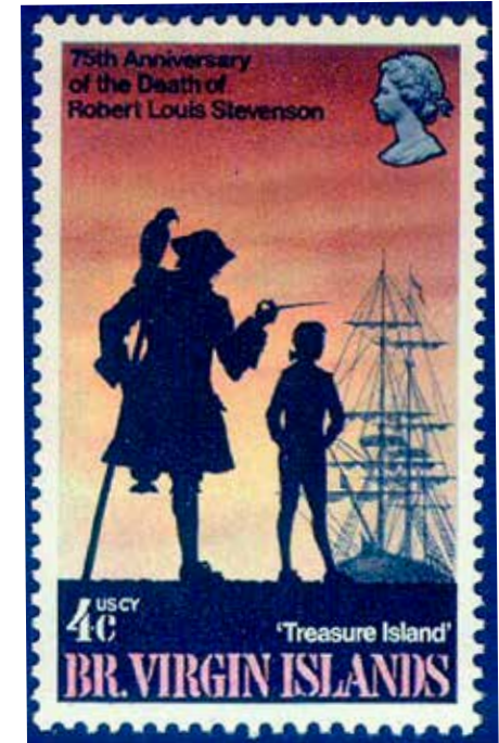
Frimärke från Brittiska Jungfruöarna 1969 föreställande Long John Silver med sin papegoja.

När de europeiska båtarna ankom till hamnar i tropikerna var det vanligt att köpmän eller lokalbor kom ut i enkla båtar och kanoter för att erbjuda besättningen olika varor och exotiska souvenirer, däribland apor, pa-