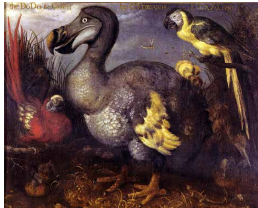
Dront fångades på ön Mauritius och fördes under 1600-talet med som proviant men också som sällskap och vi vet att åtminstone ett dussin dronter nådde Europa. På båtarna utfodrades dronter med skeppskex. Förmodligen var de liksom duvor i fångenskap storätare och lade på vikt av denna diet. Bilder på dronter visar ofta tjocka, kalkonliknade fåglar, och de var helt enkelt överviktiga. I vilt tillstånd levde de förmodligen av frukter och var betydligt slankare än vad avbildningarna ger vid handen. Målning av Roelant Savery från 1626. Natural History Museum, London (Wikimedia Commons, Public Domain).

Andra djur, såsom får, getter, höns och svin fördes med i levande tillstånd och hörde till provianten. Om levande djur som skeppsproviant vid färder till tropikerna diskuterades ännu i Kungl. Socialstyrelsens utredning om sjömansyrket i Sverige från 1915. 10 Havssköldpaddor och jättesköldpaddor levde länge ombord och slutade i manskapets magar. Per Osbeck ger en detaljerad beskrivning från ön Ascension i Sydatlanten av hur sjöfolk gick iland och samlade soppsköldpaddor. De kunde hållas levande ombord i veckor innan de slaktades och en sköldpadda motsvarade en ox. Det var ett viktigt proteintillskott ombord för Ostindienfararna. 11 Även Carl Peter Thunberg berättar att besättningen på den båt han färdades med i juni 1788 gick i land på ön Ascension för att hämta soppsköldpaddor som proviant. 12 Kommersen med soppsköldpaddor på ön Ascension var en väl utvecklad hantering av vital betydelse för gångna tiders handelsflotta. Prästen Gustaf Fredrik Hjortsberg på Gustavsberg skrev till och med ett epitafium över en soppsköldpadda på Ascension. Kommersen förlorade i betydelse först när Suezkanalen öppnades. 13