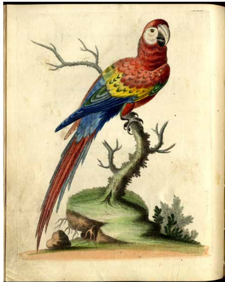
Ljusröd ara från Mellan- och Sydamerika. Sjömän förde ofta med denna praktfulla och närbesläktade papegojor till Europa. Redan Christopher Columbus hade röda västindiska aror med när han återvände till Spanien. Aror blir lätt tama och blev tidigt populära. Från Sverige föreligger uppgifter om att Karl XI hade flera slags aror i sitt privata menageri (Ur George Edwards A Natural History of Uncommon Birds 1743).